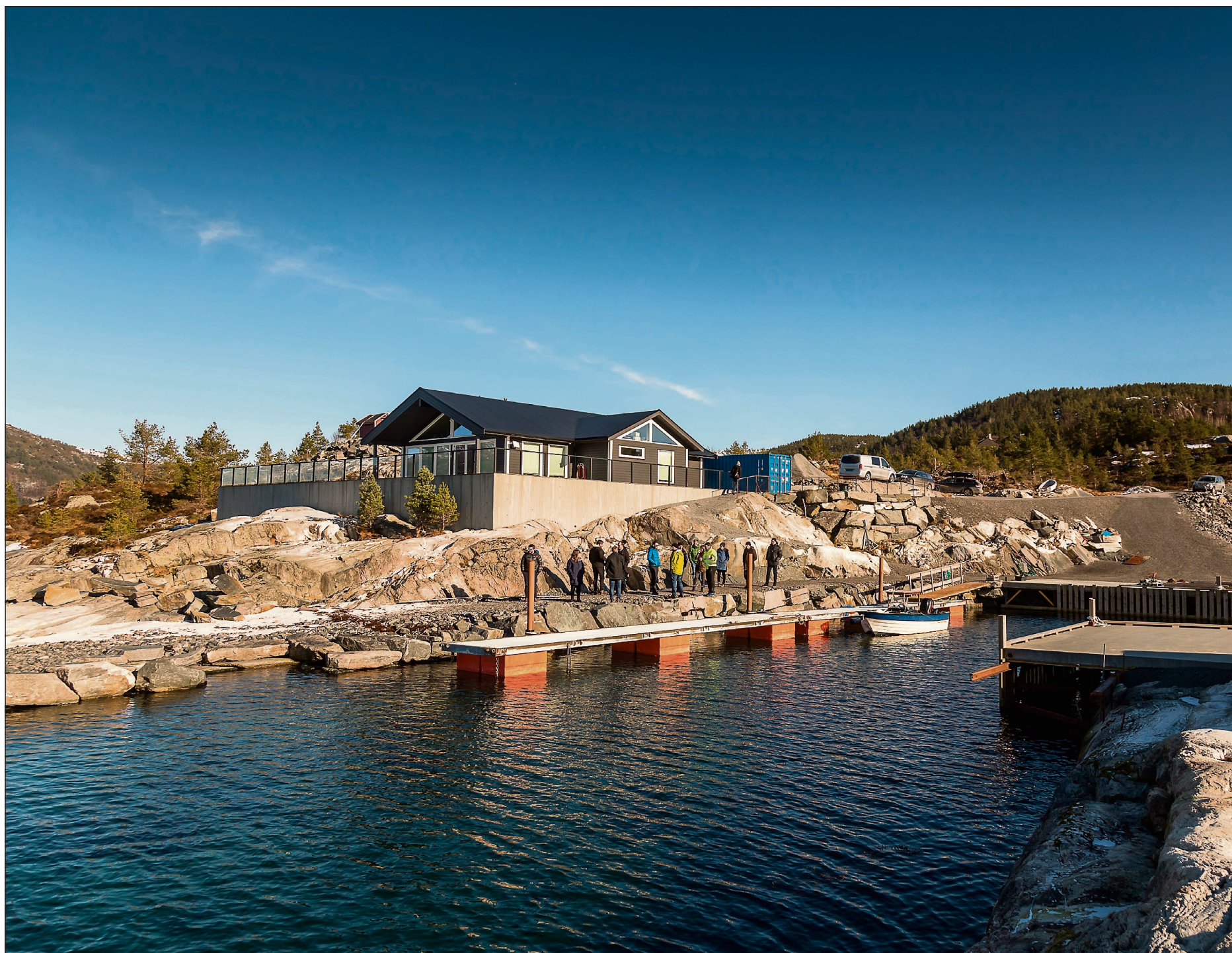
OMSTRIDD HYTTE: Bildet er frå ei av synfaringane frå det offentlege på tomta.