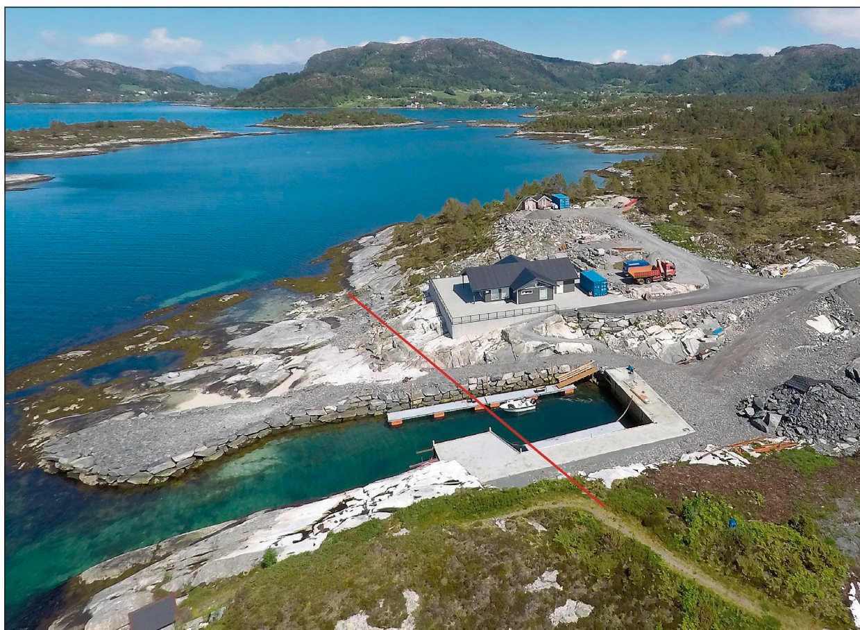
DRONEFOTO: Mykje av arealet framfor hytta er regulert som friluftsområde. Ifølge naboane var dette ein populær badeplass tidlegare. Hytteeigaren har gjort store inngrep i området.